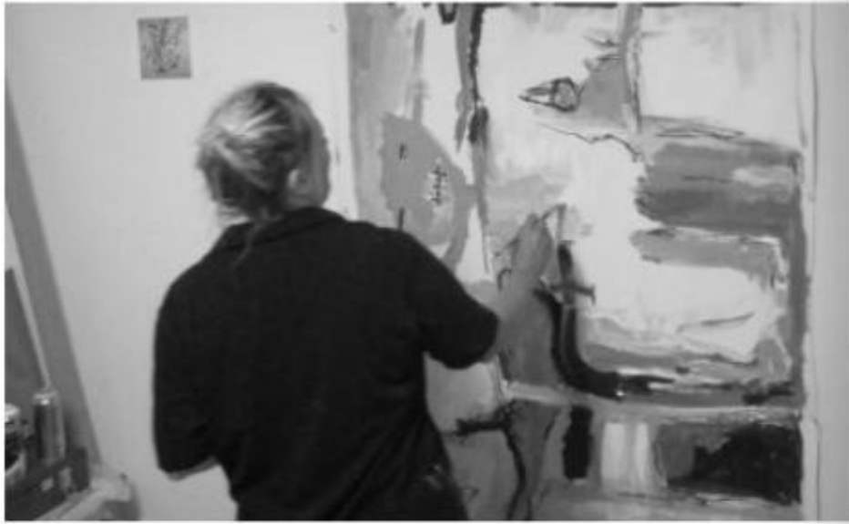
Malerei und Zeichnungen nach Musik